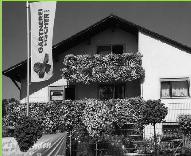
Wir haben die Tipps, die Pflanzen und die Pflegemittel für Ihren Garten, Terrasse oder Balkon!

Ein Anruf genügt und wir führen Ihren Auftrag gerne nach Ihrem Wunsch aus. Dies gilt sowohl für Lieferungen ins Umland oder für Fleurop-Aufträge!